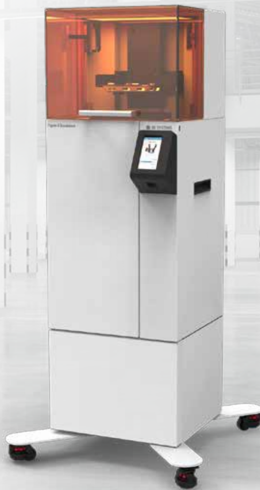
Figure 4 Standalone은 3D Systems의 확장 가능하고 완전 통합된 Figure 4 기술 플랫폼의 일부이며 소량 생산 및 빠른 설계 반복과 검증을 위한 당일 원형 제작에 적합한 경제적이고 다재다능한 솔루션입니다. 산업 등급의 내구성, 서비스 및 지원을 통해 속도, 품질 및 정확성을 제공합니다.